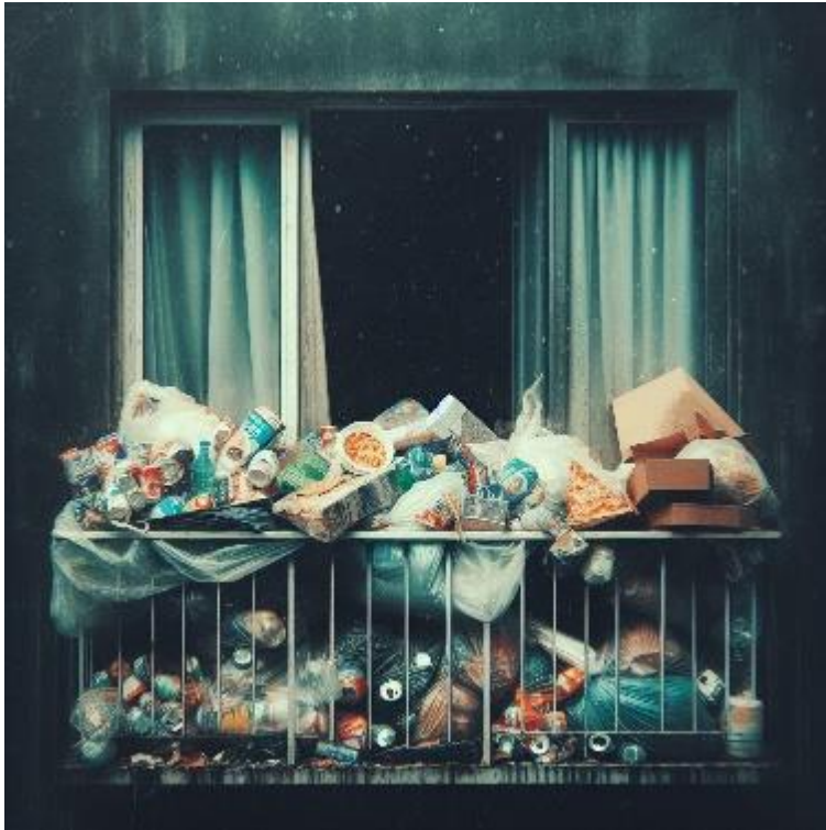
Bild 5. Exempel på en balkong, vars materialmängd förhindrar räddning via den.

Om bostaden är rökfylld, kan personerna i bostaden beordras att ta sig ut på balkongen. Därför får inte material förvaras på balkongen i sådan mängd att man inte kan utrymma bostaden via balkongen och räddas därifrån. En stor materialmängd på balkongen utgör också en brandbelastning.