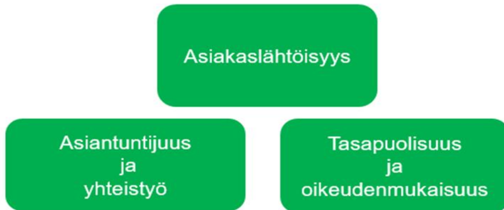
Kuva 3. Valvontatyötä ohjaavat arvot.

Hyvinvointialueen valvontatyötä tekevinä viranomaisina olemme sitoutuneet toimimaan hyvinvointialueen yhteisten arvojen mukaisesti. Hyvinvointialueen arvot näkyvät vahvasti myös valvontatyötämme keskeisesti ohjaavissa arvoissa (kuva 3.)