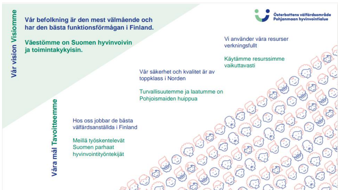
Kuva 1. Pohjanmaan hyvinvointialuestrategia 2023–2026.