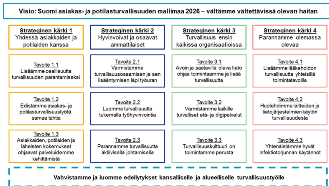
Kuva 5. Asiakas- ja potilasturvallisuus strategia ja toimeenpanosuunnitelma 2022–2026 (STM 2022).

Valvontasuunnitelman laadinnasta, toteutuksesta ja raportoinnista vastaa valvonnan päällikkö. Valvontasuunnitelman valmisteleo omavalvonnan ohjausryhmä. Valvontasuunnitelman hyväksyy hyvinvointialueen johtoryhmä, ja se viedään aluehallitukselle tiedoksi. Hyvinvointialueen valvontasuunnitelma päivitetään vuosittain Sosiaali- ja terveydenhuollon valtakunnallisen valvontaohjelman ja Pohjanmaan hyvinvointialueen kullekin vuodelle valitsemien painopistealueiden ohjaamina. Valvontatyön suunnittelussa ja toteutuksessa huomioidaan myös Sosiaali- ja terveysministeriön vuosille 2022–2026 laatiman Asiakas- ja potilasturvallisuusstrategia , ja sen toimeenpanosuunnitelman tavoitteet (kuva 5).